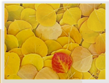
Photo: Leaves

PARTENARIAT COMMUNAUTE EN SANTE (PCS) LE RESEAU POUR LA SANTE